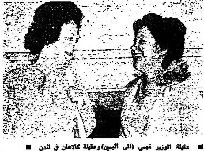
معتلة الوزير فهمي (الى اليمين) ومعتلة كالاغان في لندن

وقال السيد اساميل فهمي وزير الخارجية المصري الى مديريه من لندن، وقال قبل سفره ان محادثات مع المسؤولين البريطانيين كتبت ودية للغاية، وان صفقة الاسلحة البريطانية ان تكون قاصرة على مصر ونسبة، وانما ستشمل دولا عربية اخرى.